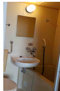
よくしつ 浴室、トイレ（居室）