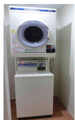
しきせんたくき なんごうかんほんたいじゆうきよきょうゆうぶ コイン式洗濯機（南郷館本体住居共有部）