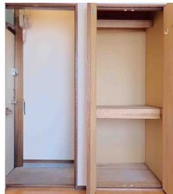
げんかん きょしつしゆうのう 玄関、居室収納